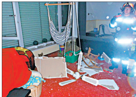
Verwüstet: Das Kinderzimmer nach dem Blitz.

ganze Haus verraucht. Aber zum Glück hatten die beiden Mädchen (8 und 9), die im ge-