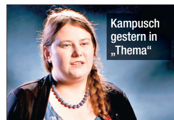
Kampusch gestern in „Thema“