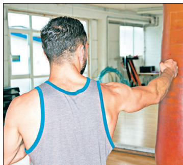
Junge Häftlinge dürfen Dampf ablassen.

„Tausende Euro im Monat werden für so was ausgegeben, aber wir Beamte müssen dann nicht nur mit den Häftlingen, sondern sogar um die Bezahlung der Überstunden raufen“, erklärt ein