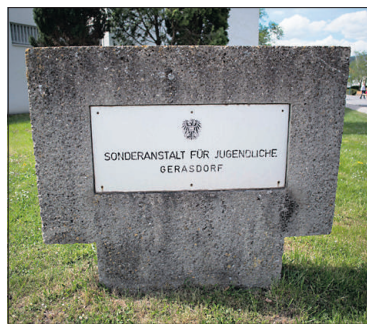
Gerasdorf: Rund 90 Insassen sitzen hier.